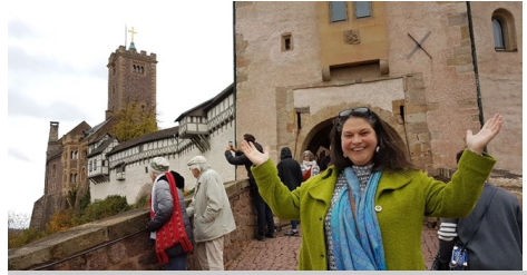
Auf der Wartburg 2023

Eine weitere Begegnung erfolgte 2023, als wir wieder eine Gemeindefahrt um die Reformationszeit angeboten und im Osten unterwegs waren und u.a. die Wartburg besucht haben (s. Bild). Und dann erinnere ich mich noch gern an die kurze Stippvisite bei Bernd Kramer und dem Seniorenkreis im Juni