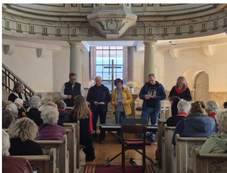
Der Gemeindekirchenrat ist dankbar für die „Fertigstellung“ des Kirchturmes.