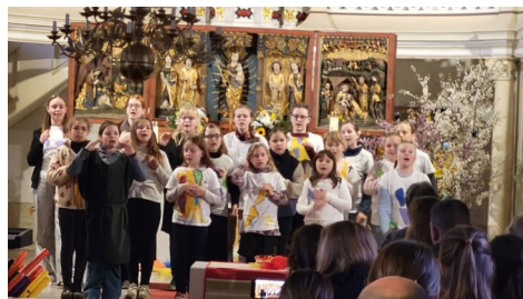
Singefreizeit 2026-Auftritt Schwabhausen