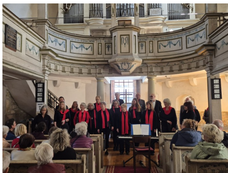
beeindruckendes Konzert des Gesangsvereins 1991 Neudietendorf e.V.