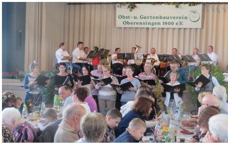
Herbstfest des OGV 2016