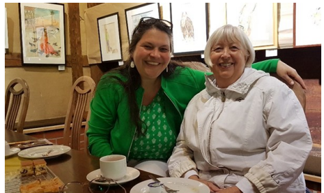
Beim Seniorenkreis 2024