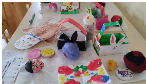
Kirchendetektive in Wechmar